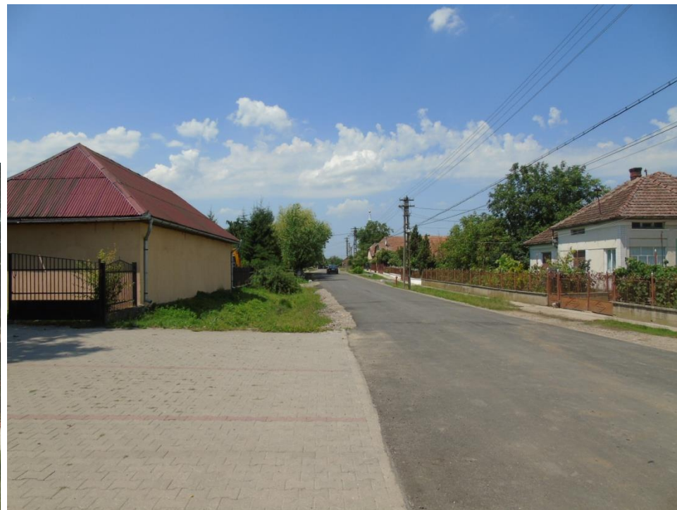
Strada spre Biserica Reformată Doba în 2017

Proiect finanțat de Ministerul Culturii și Identității Naționale Beneficiarul proiectului: Județul Satu Mare, Consiliul Județean Implementat și coordonat de Biblioteca Județeană Satu Mare