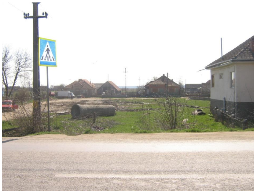
Lângă Oficiul Poștal Doba 2006