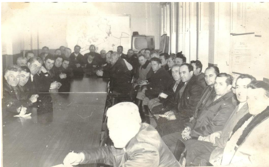
Ședința Organizației de Partid la sediul CAP Doba 1970