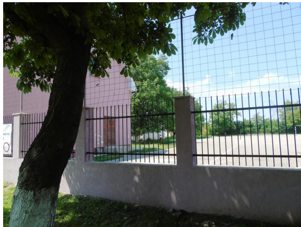
Curtea Școlii Generale 2017

Proiect finanțat de Ministerul Culturii și Identității Naționale Beneficiarul proiectului: Județul Satu Mare, Consiliul Județean Implementat și coordonat de Biblioteca Județeană Satu Mare