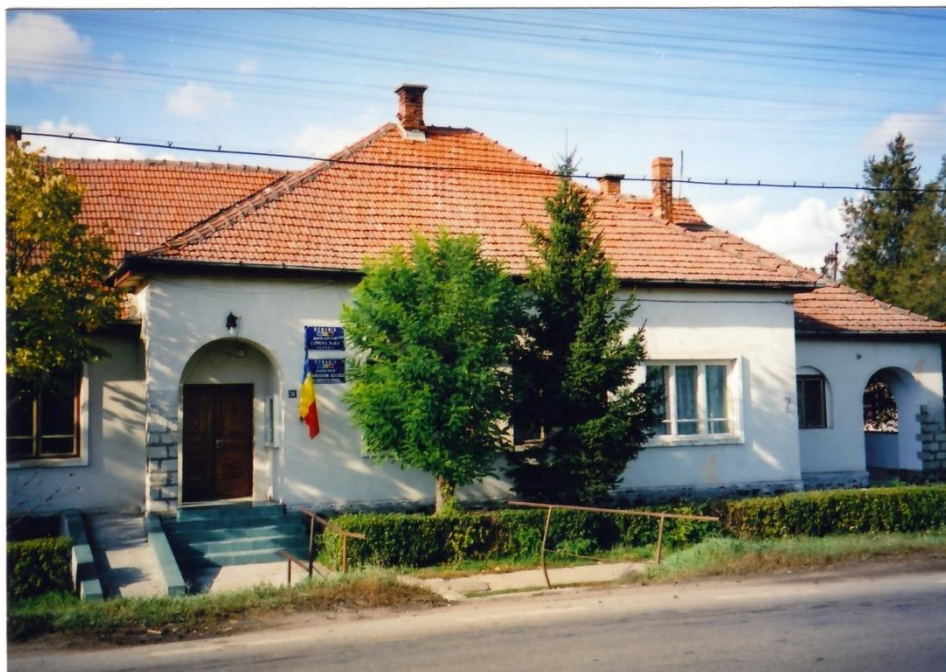
Primăria Doba 2006