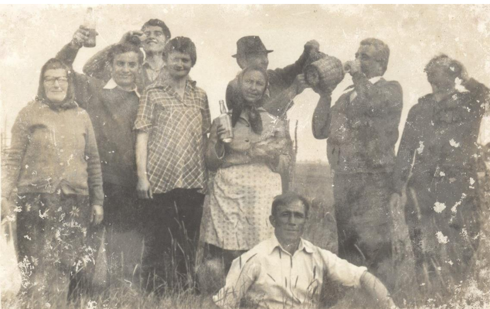
Sâmbra oilor în localitatea Păulian 1971

Petrecere câmpenească cu ocazia mulsului oilor în satul Dacia 1979