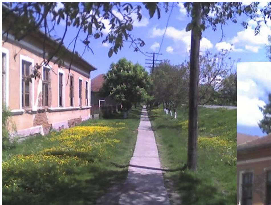
Școala Generală în 2006