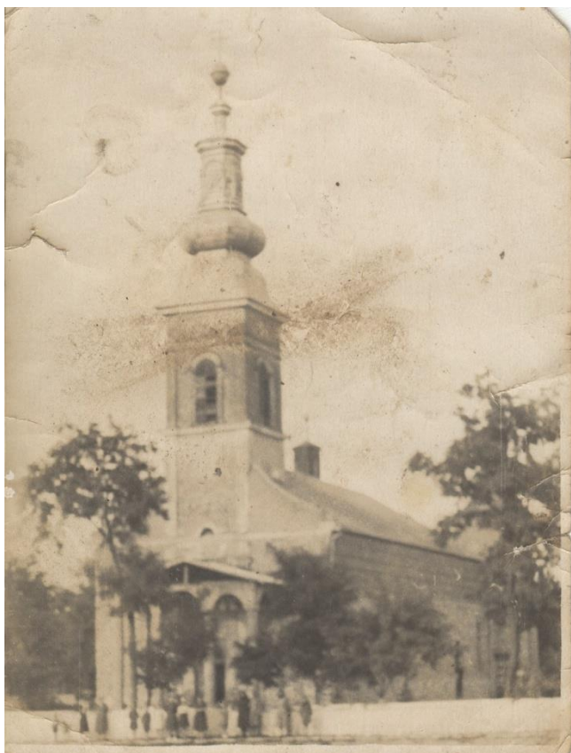
Biserica Ortodoxă 1964