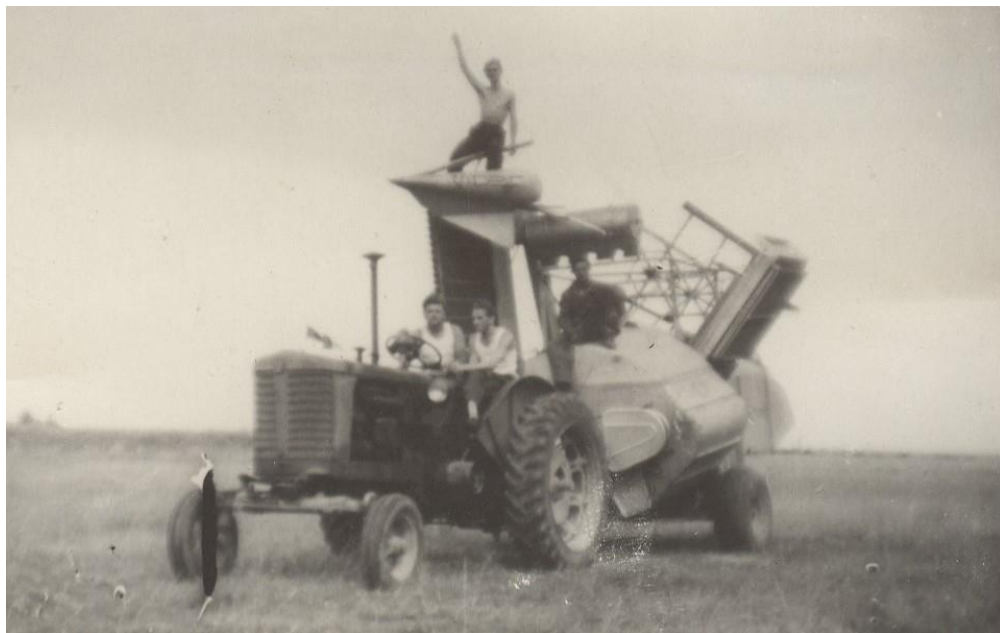
La munca câmpului cu utilaje agricole în Sătmărel 1961 - 1962