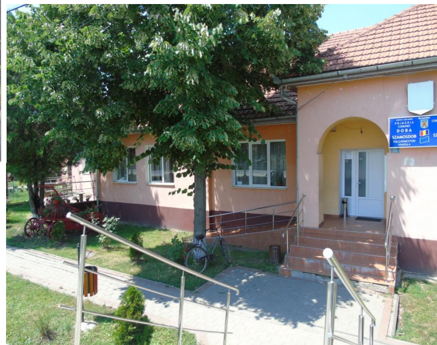
Primăria Doba 2017

Proiect finanțat de Ministerul Culturii și Identității Naționale Beneficiarul proiectului: Județul Satu Mare, Consiliul Județean Implementat și coordonat de Biblioteca Județeană Satu Mare