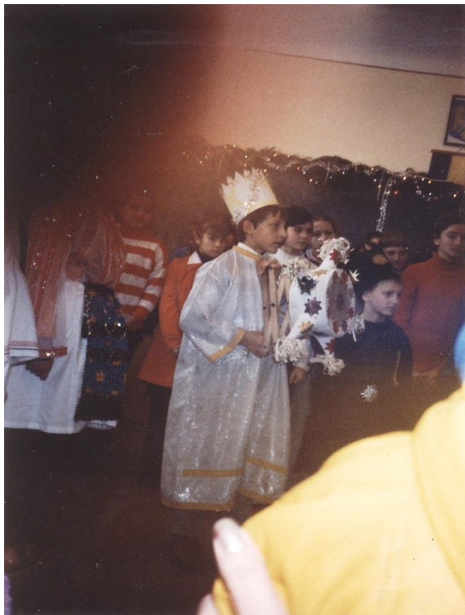
La colind cu Steaua 2005