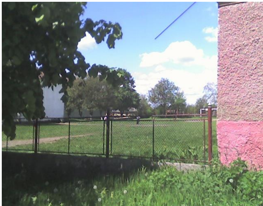
Curtea Școlii Generale 2006