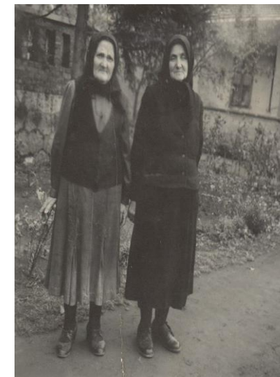
Surorile Tasi 1959