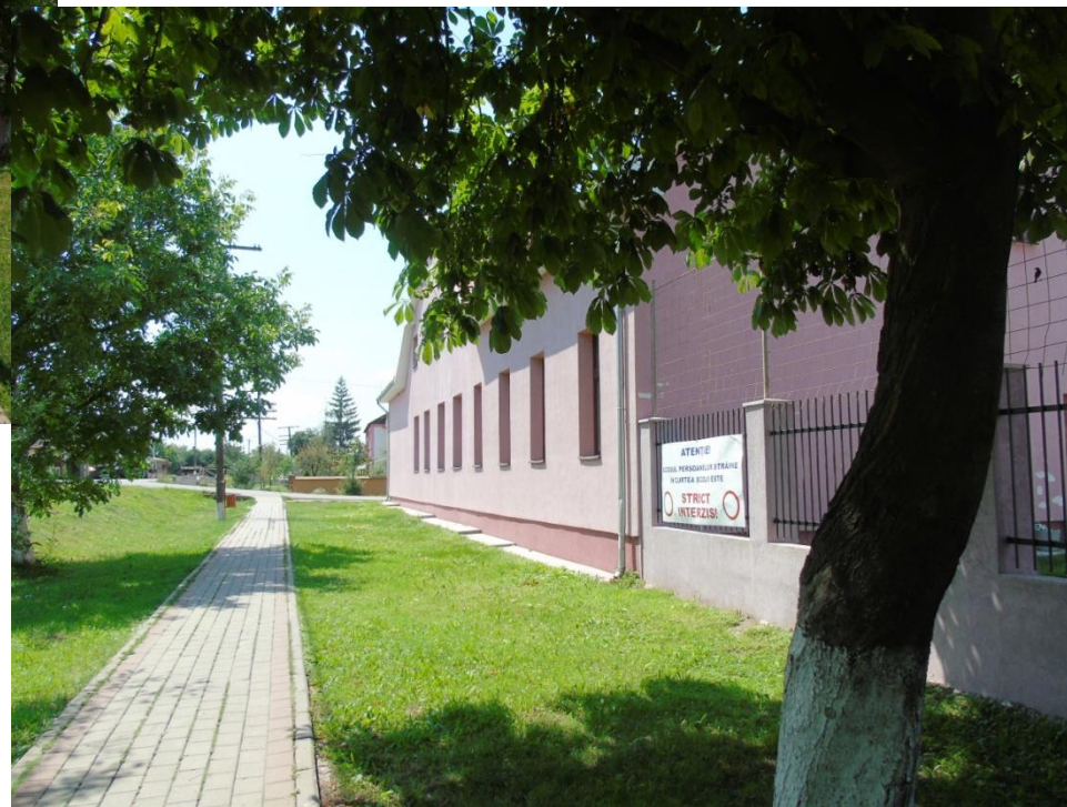
Școala Generală reabilitată 2017

Proiect finanțat de Ministerul Culturii și Identității Naționale Beneficiarul proiectului: Județul Satu Mare, Consiliul Județean Implementat și coordonat de Biblioteca Județeană Satu Mare