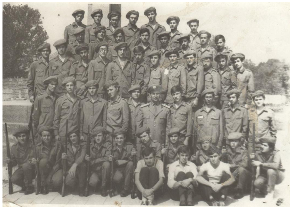
Tineri din Doba cu detașamentul 8 din Satu Mare la Blaj 1971

Proiect finanțat de Ministerul Culturii și Identității Naționale Beneficiarul proiectului: Județul Satu Mare, Consiliul Județean Implementat și coordonat de Biblioteca Județeană Satu Mare