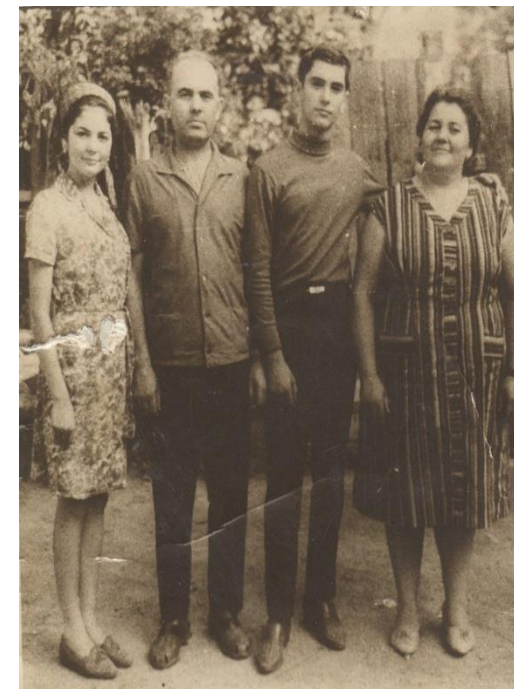
Familie din satul Dacia 1969

Proiect finanțat de Ministerul Culturii și Identității Naționale Beneficiarul proiectului: Județul Satu Mare, Consiliul Județean Implementat și coordonat de Biblioteca Județeană Satu Mare