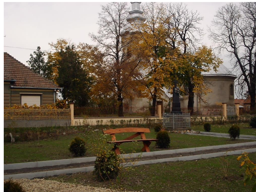
Biserica Reformată Boghiș în 2017

Proiect finanțat de Ministerul Culturii și Identității Naționale Beneficiarul proiectului: Județul Satu Mare, Consiliul Județean Implementat și coordonat de Biblioteca Județeană Satu Mare