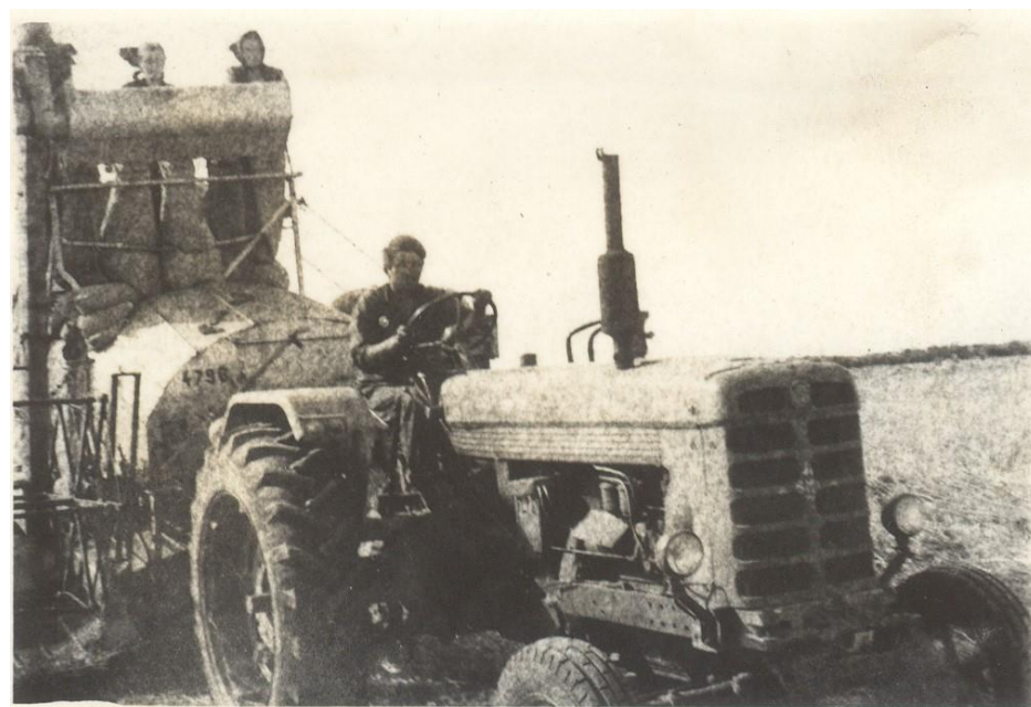
La seceriș 1970

Proiect finanțat de Ministerul Culturii și Identității Naționale Beneficiarul proiectului: Județul Satu Mare, Consiliul Județean Implementat și coordonat de Biblioteca Județeană Satu Mare