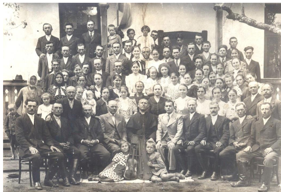
Corul localității Moftin în 1938

Proiect finanțat de Ministerul Culturii și Identității Naționale Beneficiarul proiectului: Județul Satu Mare, Consiliul Județean Implementat și coordonat de Biblioteca Județeană Satu Mare