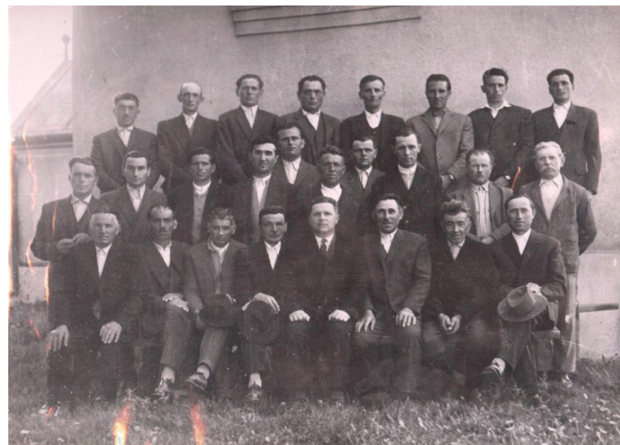
Corul Bisericii Reformate din Boghiș în 1969

Proiect finanțat de Ministerul Culturii și Identității Naționale Beneficiarul proiectului: Județul Satu Mare, Consiliul Județean Implementat și coordonat de Biblioteca Județeană Satu Mare