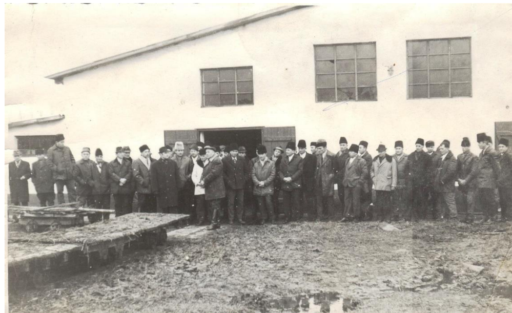
Vizită la ferma zootehnică Doba 1974