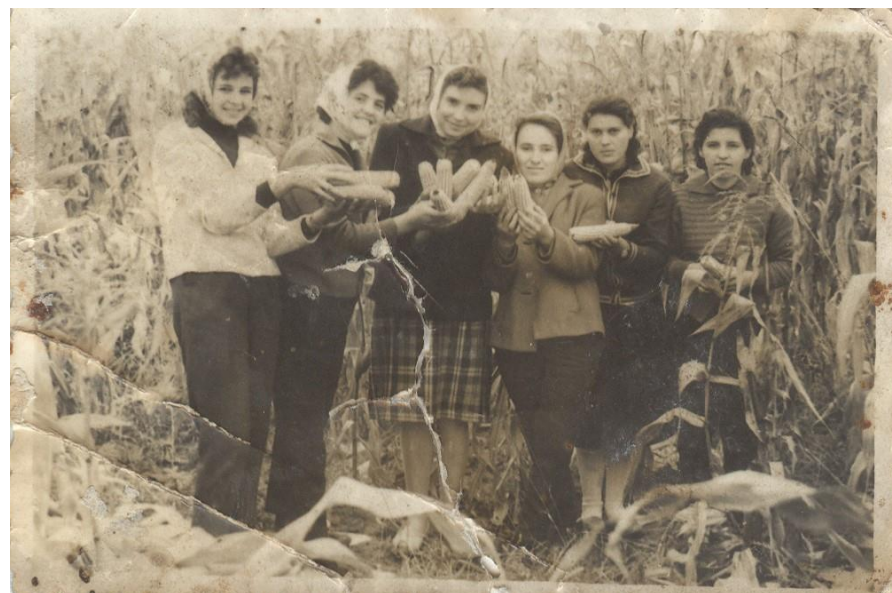
La cules de porumb 1977

Proiect finanțat de Ministerul Culturii și Identității Naționale Beneficiarul proiectului: Județul Satu Mare, Consiliul Județean Implementat și coordonat de Biblioteca Județeană Satu Mare