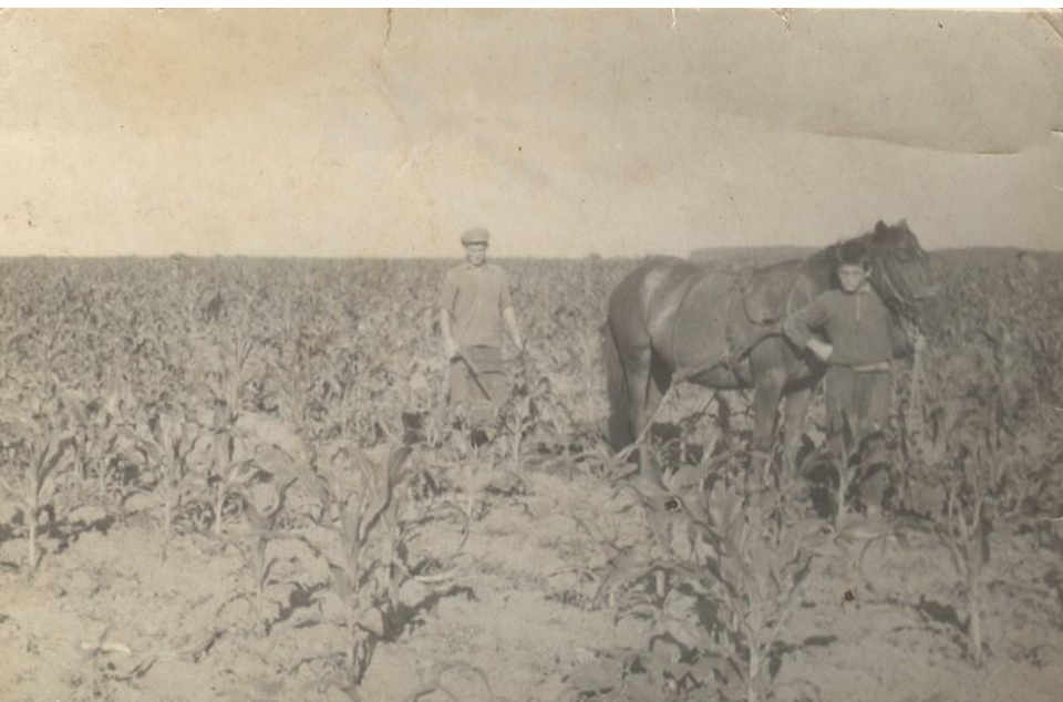
La prășit 1950