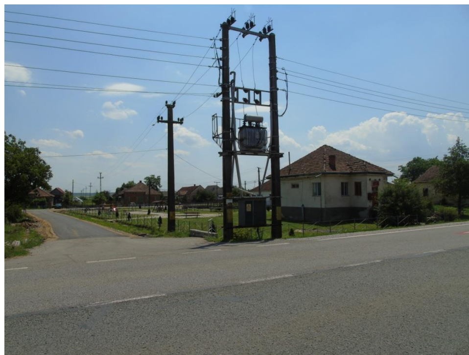
Lângă Oficiul Poștal Doba 2017

Proiect finanțat de Ministerul Culturii și Identității Naționale Beneficiarul proiectului: Județul Satu Mare, Consiliul Județean Implementat și coordonat de Biblioteca Județeană Satu Mare