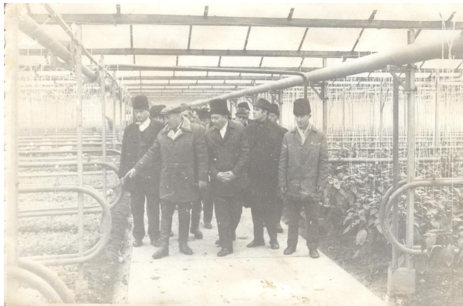
Agricultori din Doba la un schimb de experiență 1979