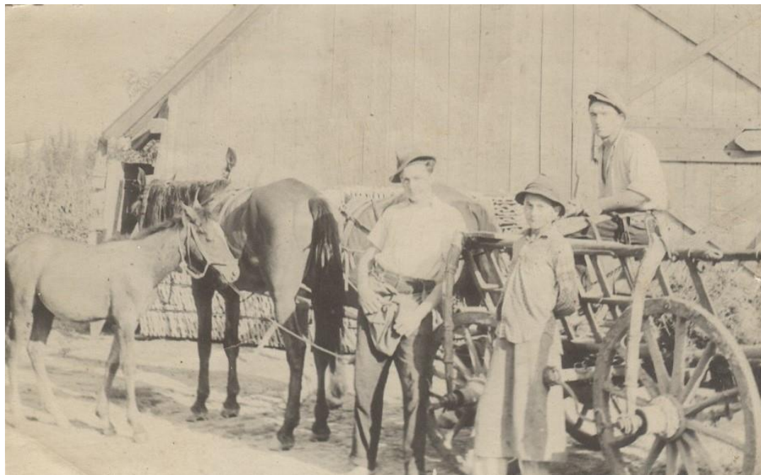
La munca câmpului înainte de colectivizare

Proiect finanțat de Ministerul Culturii și Identității Naționale Beneficiarul proiectului: Județul Satu Mare, Consiliul Județean Implementat și coordonat de Biblioteca Județeană Satu Mare