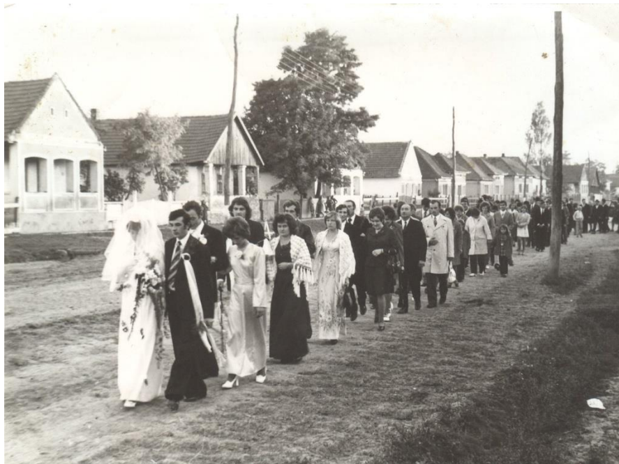
Alai de nuntă în Boghiș 1977

Tineri întorcându-se cu șareta acasă de la Starea civilă în satul Dacia 1987