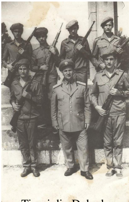
Tineri din Doba la acțiunile de pregătire pentru apărarea patriei la Blaj în 1971