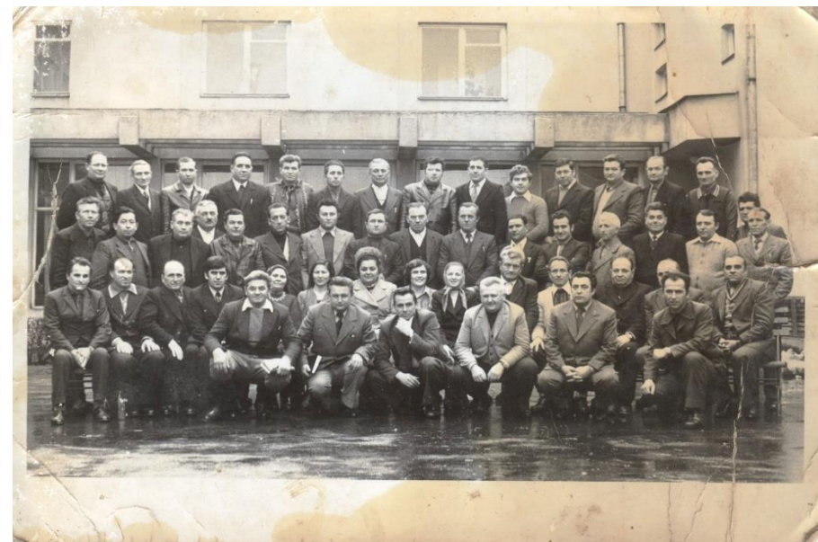
Președinții organizațiilor PCR din județul Satu Mare la o întâlnire în 1972

Proiect finanțat de Ministerul Culturii și Identității Naționale Beneficiarul proiectului: Județul Satu Mare, Consiliul Județean Implementat și coordonat de Biblioteca Județeană Satu Mare