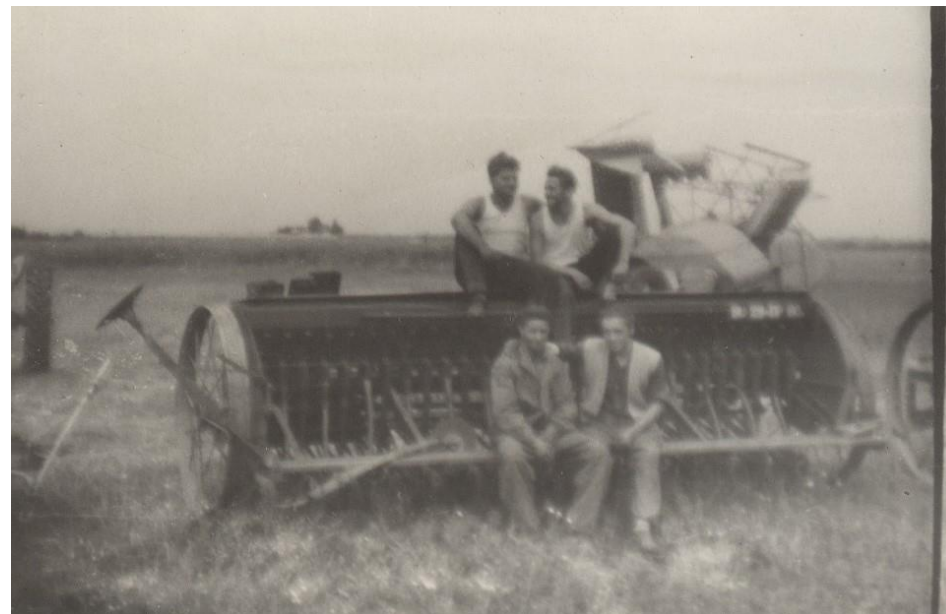
La munca câmpului cu utilaje agricole în Sătmărel 1961

Proiect finanțat de Ministerul Culturii și Identității Naționale Beneficiarul proiectului: Județul Satu Mare, Consiliul Județean Implementat și coordonat de Biblioteca Județeană Satu Mare