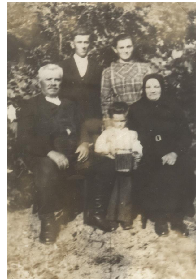
Trei generații ale fam. Koka în 1956

Proiect finanțat de Ministerul Culturii și Identității Naționale Beneficiarul proiectului: Județul Satu Mare, Consiliul Județean Implementat și coordonat de Biblioteca Județeană Satu Mare