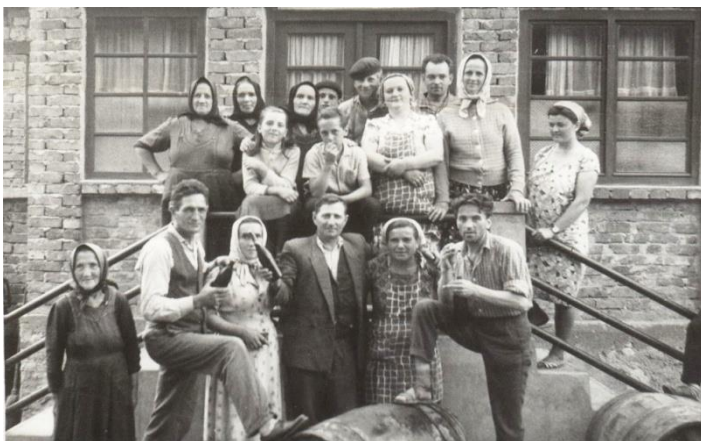
Magazinul din Medieș Vii, Centrul de colectare a căpșunilor 1965