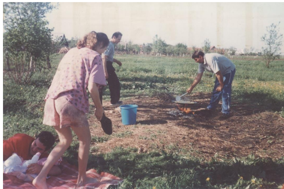
La grătar la iarbă verde în satul Dacia 2008

Proiect finanțat de Ministerul Culturii și Identității Naționale Beneficiarul proiectului: Județul Satu Mare, Consiliul Județean Implementat și coordonat de Biblioteca Județeană Satu Mare