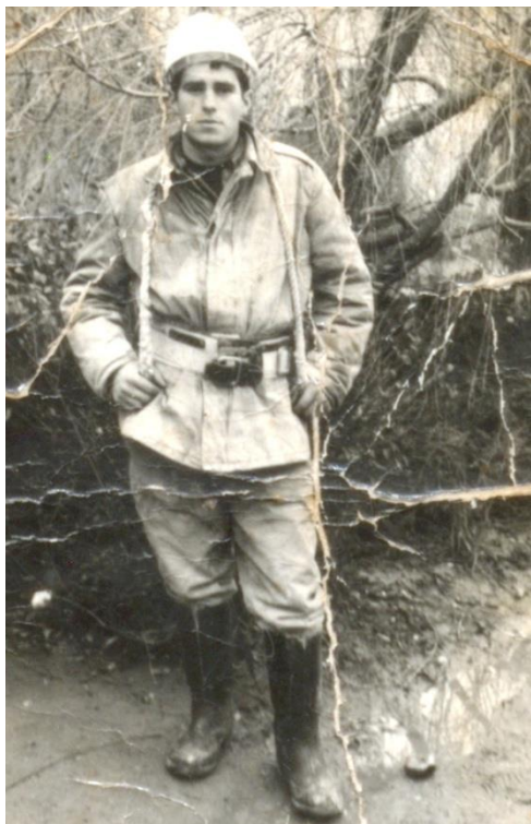
Miner de la Mina Turț (1988)