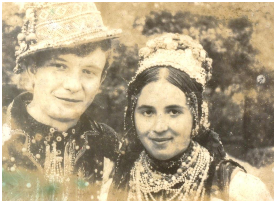
Miri din Oaş (1983)