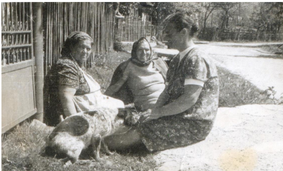
Vecine, în zi de sărbătoare, la povești pe ulița satului (1990)