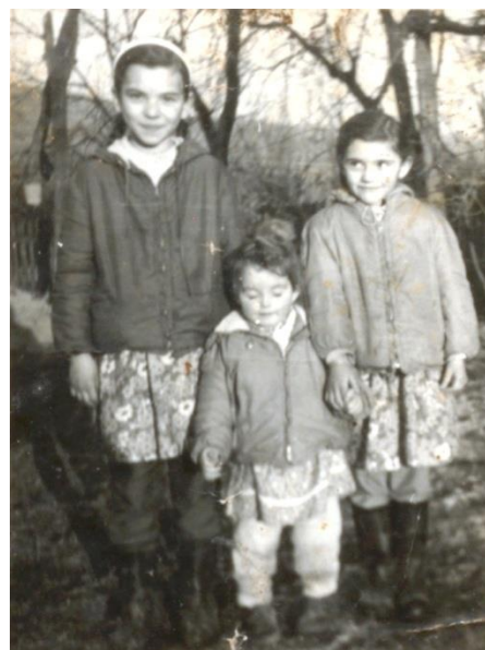
Trei surori (1973)

Mătușă și nepoată în anii '70. În plan secund, o casă tradițională din Oaș, împrejmuită cu gard de nuiele