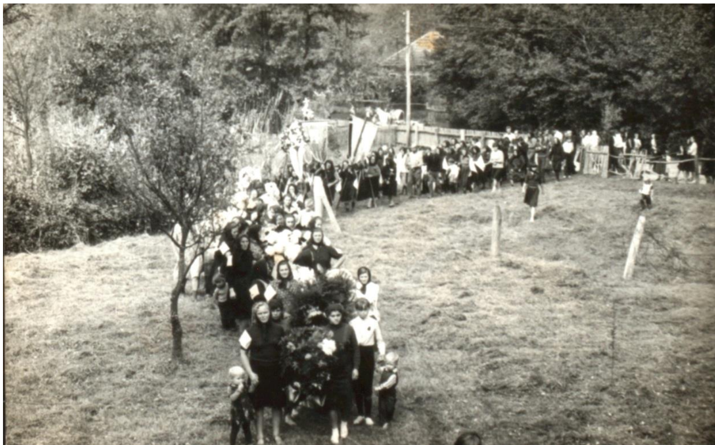
Cortegiu funerar (1979)

Proiect finanțat de Ministerul Culturii și Identității Naționale Beneficiarul proiectului: Județul Satu Mare, Consiliul Județean Implementat și coordonat de Biblioteca Județeană Satu Mare