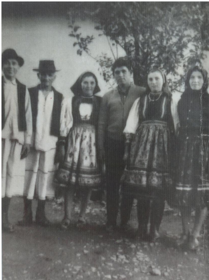
Familie de oșeni (1961)