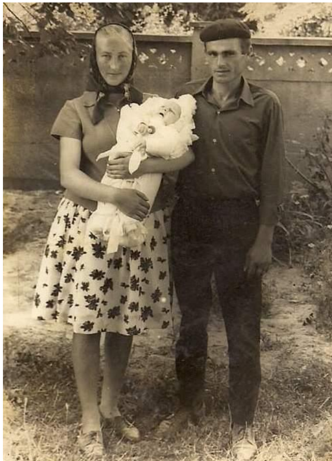
Familie de oșeni din anii 70, Tarna Mare