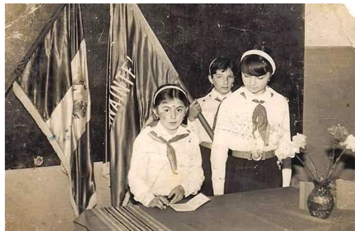
Școala Tarna Mare 1970-1980