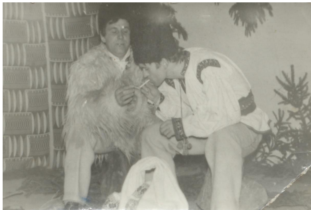
„Oșenii” – piesă de teatru pusă în scenă în anul 1980