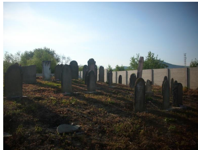
Cimitirul evreiesc din Tarna Mare