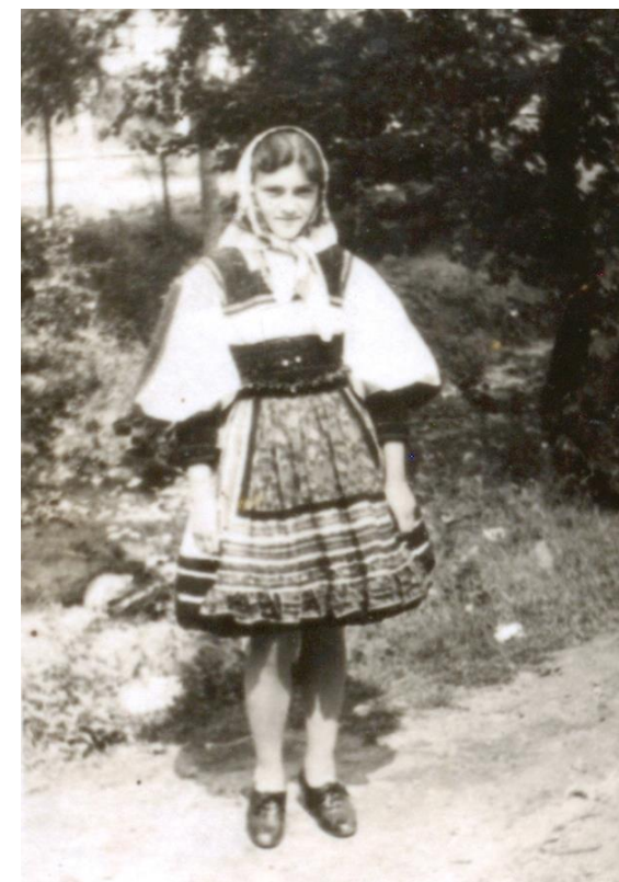
Îmbrăcăminte tradițională de sărbătoare din Tarna Mare (1955-1958)