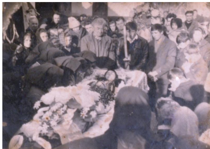
Slujbă de înmormântare (1969)

Proiect finanțat de Ministerul Culturii și Identității Naționale Beneficiarul proiectului: Județul Satu Mare, Consiliul Județean Implementat și coordonat de Biblioteca Județeană Satu Mare