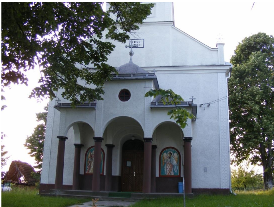
Biserica din Bocicău