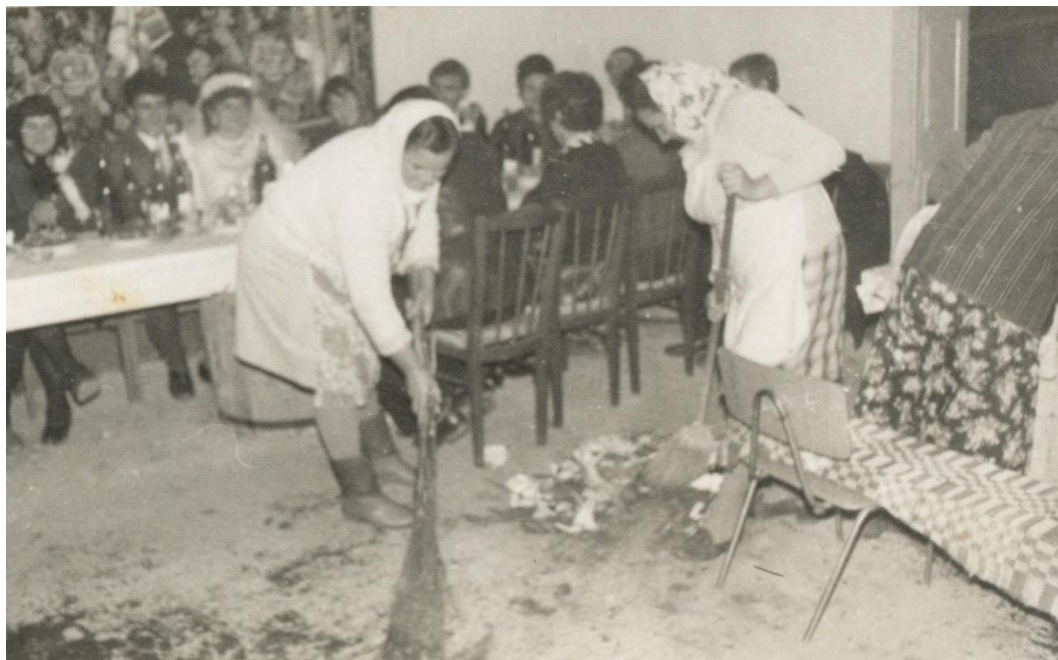
Socăcițele curăță sala de nunți

Proiect finanțat de Ministerul Culturii și Identității Naționale Beneficiarul proiectului: Județul Satu Mare, Consiliul Județean Implementat și coordonat de Biblioteca Județeană Satu Mare