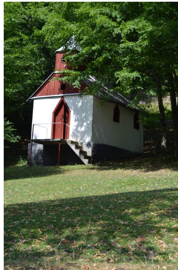
Băile termale Tarna Mare

Proiect finanțat de Ministerul Culturii și Identității Naționale Beneficiarul proiectului: Județul Satu Mare, Consiliul Județean Implementat și coordonat de Biblioteca Județeană Satu Mare