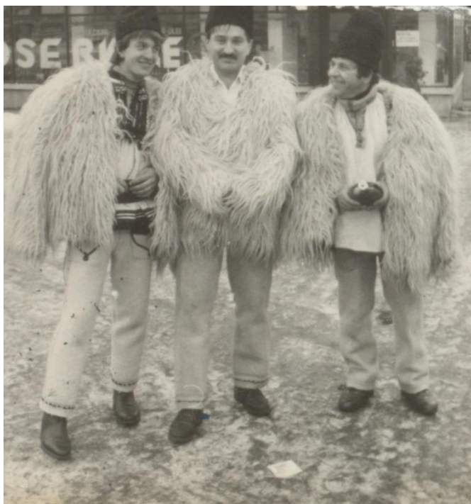
„Oșenii” – piesă de teatru pusă în scenă în anul 1975