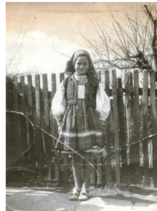
Fetiță din Oaș, în straie de sărbătoare (anii '80)