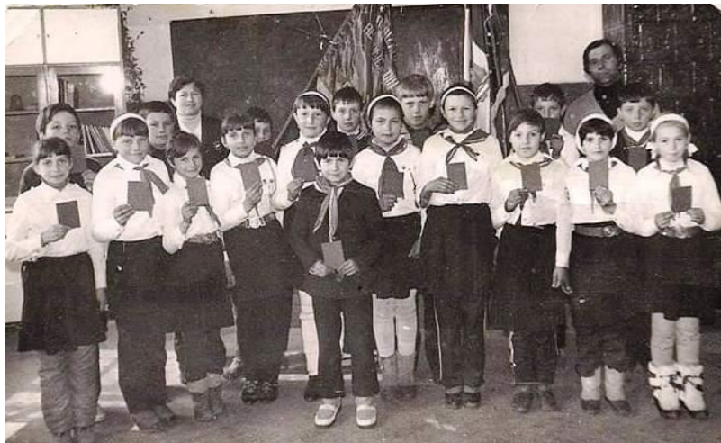
Școala Tarna Mare 1970-1980