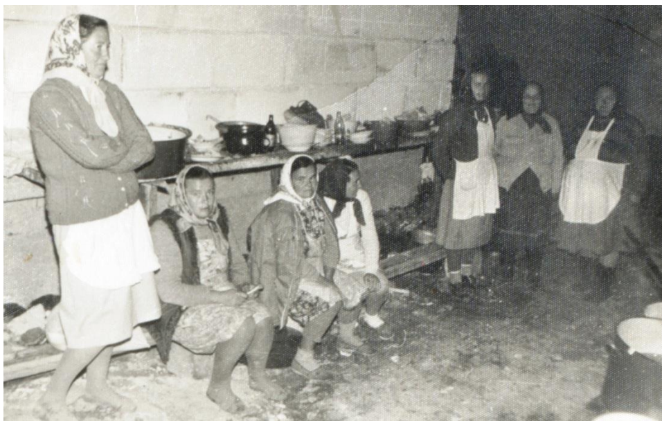
Socăcițele fac o pauză între două feluri de mâncare Tarna Mare (1992)

Bucătăresele din sat, care găteau meniul servit la nunți, sunt denumite în termen popular „socăcițe”