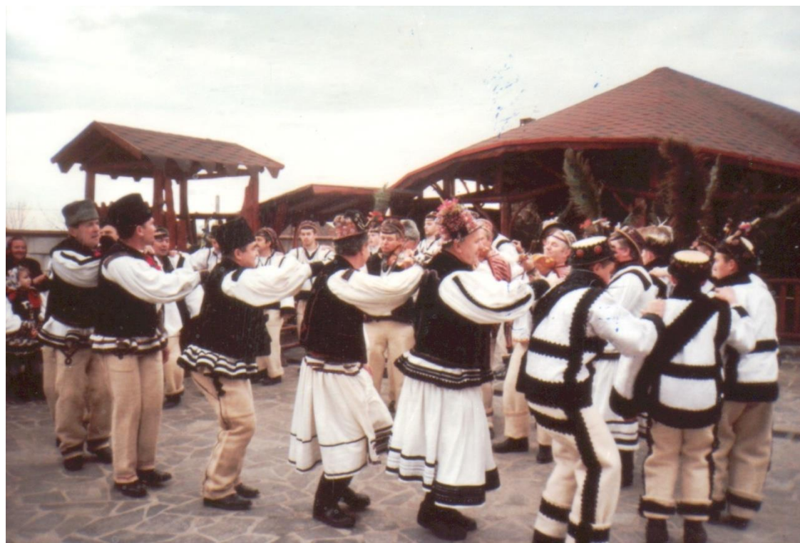
Dansul oșenesc „roata feciorilor” (2014)

Proiect finanțat de Ministerul Culturii și Identității Naționale Beneficiarul proiectului: Județul Satu Mare, Consiliul Județean Implementat și coordonat de Biblioteca Județeană Satu Mare