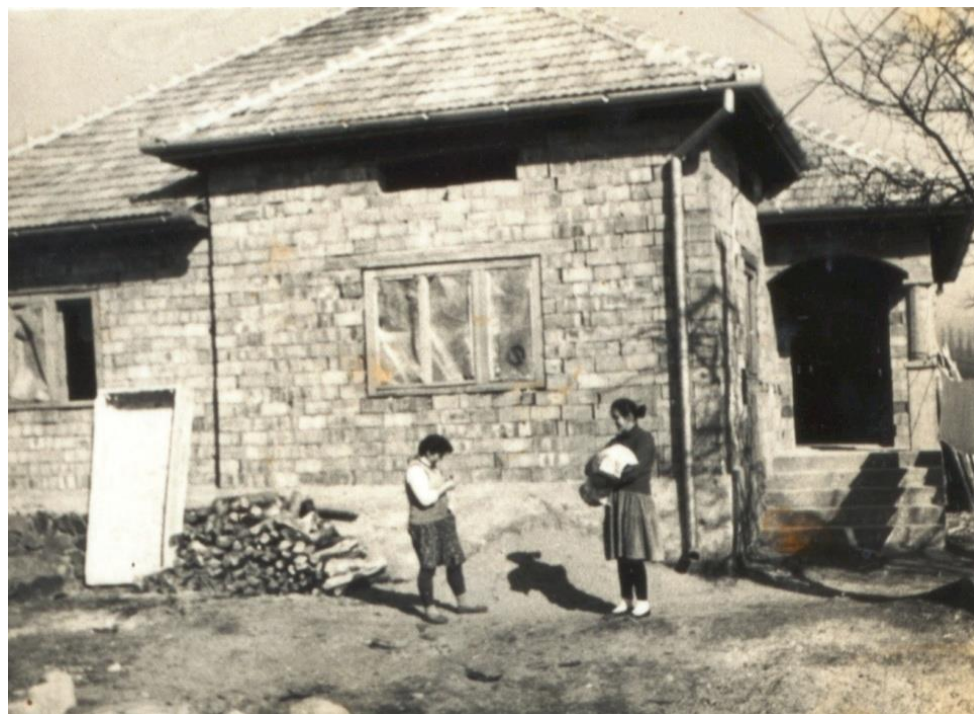
Casă în construcție, 1990