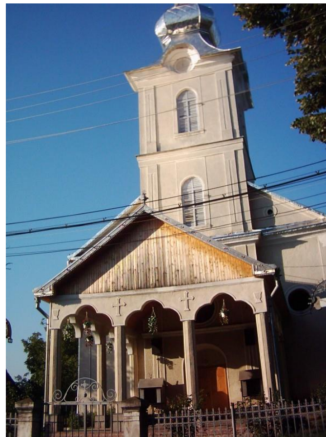
Biserica Ortodoxă din Tarna Mare

Proiect finanțat de Ministerul Culturii și Identității Naționale Beneficiarul proiectului: Județul Satu Mare, Consiliul Județean Implementat și coordonat de Biblioteca Județeană Satu Mare