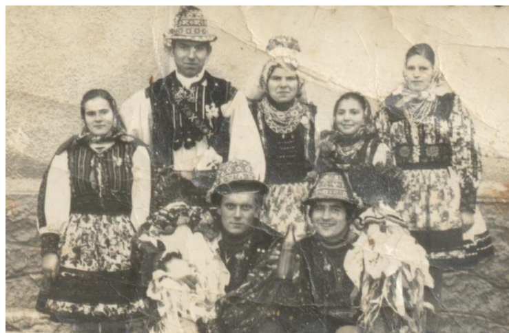
Miri cu drujbe (domnișoare de onoare) și stegași (domnișori de onoare) cu steagurile (1980)