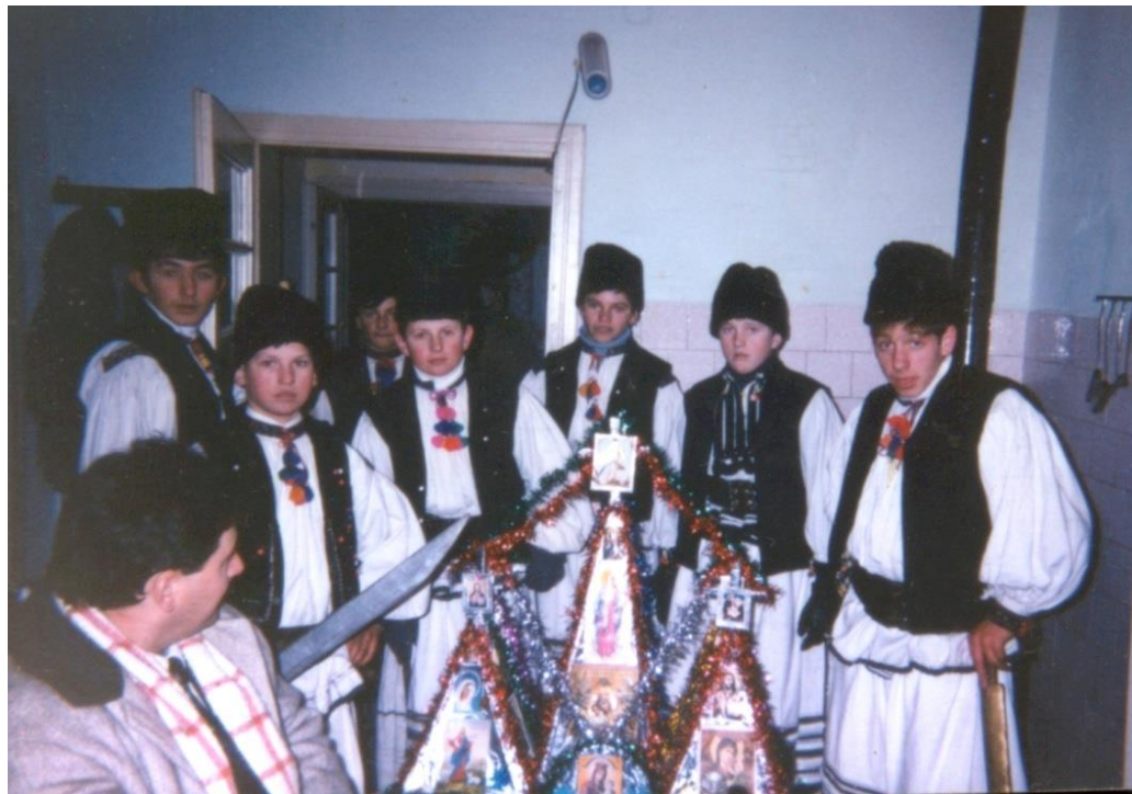
Grup de colindători în Ajunul Crăciunului „Viflaimul”, un străvechi obicei , vestește nașterea lui Iisus