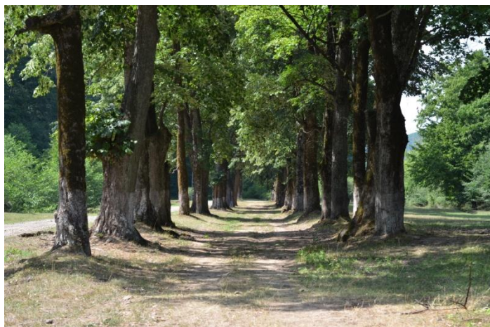
Alea teilor din Tarna Mare (2008)