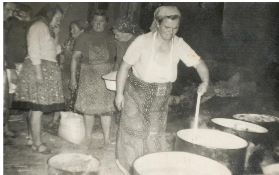
Bucătăreasa șefă (socăcița mare) amestecă în oalele cu mâncare. Tarna Mare (1992)

Proiect finanțat de Ministerul Culturii și Identității Naționale Beneficiarul proiectului: Județul Satu Mare, Consiliul Județean Implementat și coordonat de Biblioteca Județeană Satu Mare