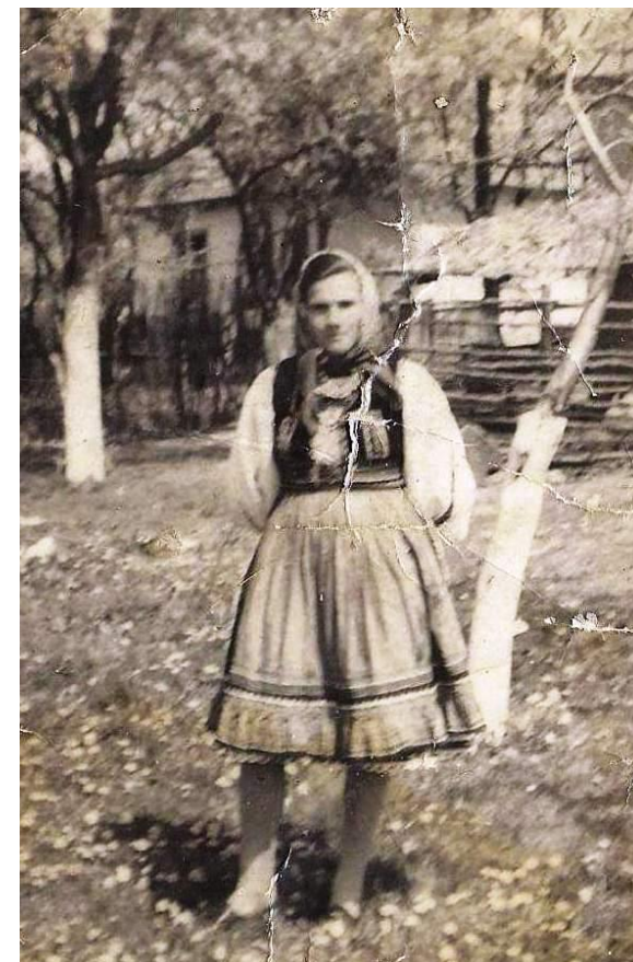
Port tradițional oșenesc din Tarna Mare

Proiect finanțat de Ministerul Culturii și Identității Naționale Beneficiarul proiectului: Județul Satu Mare, Consiliul Județean Implementat și coordonat de Biblioteca Județeană Satu Mare