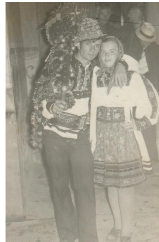
”Stegaș” și drujbă cu steag la nuntă (1980)