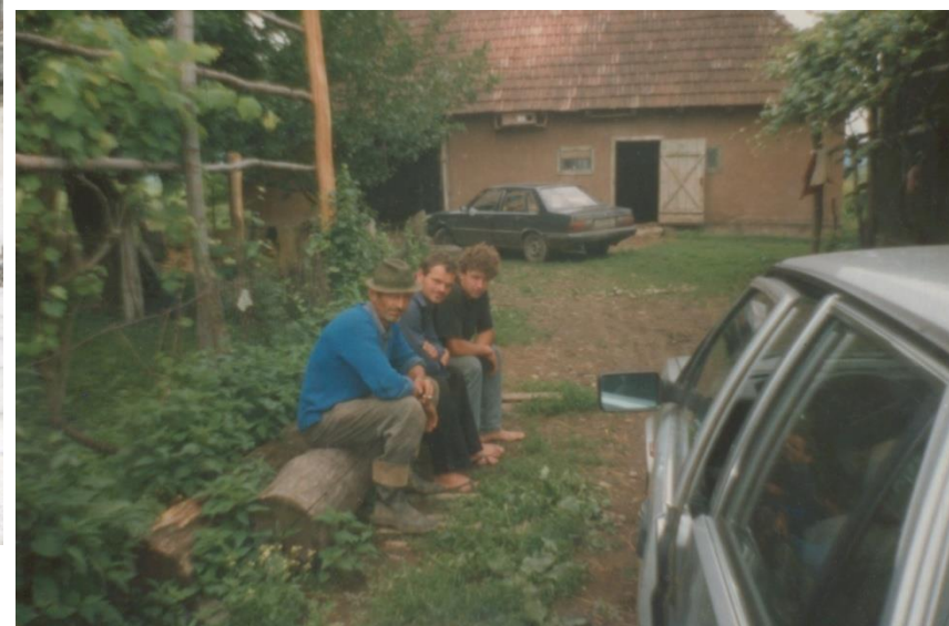
O binemeritată pauză după o muncă istovitoare

Proiect finanțat de Ministerul Culturii și Identității Naționale Beneficiarul proiectului: Județul Satu Mare, Consiliul Județean Implementat și coordonat de Biblioteca Județeană Satu Mare