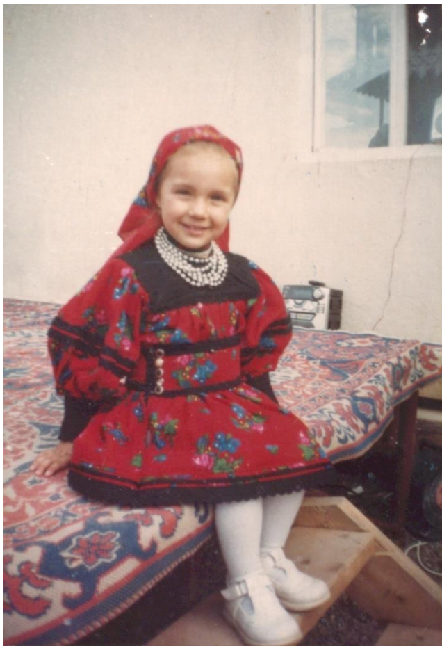
Fetiță oșencuță - Tarna Mare (2004)