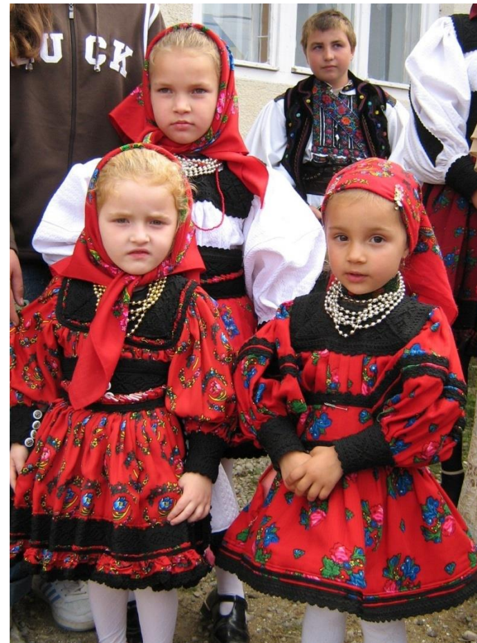
Oșencuțe din Tarna Mare

Proiect finanțat de Ministerul Culturii și Identității Naționale Beneficiarul proiectului: Județul Satu Mare, Consiliul Județean Implementat și coordonat de Biblioteca Județeană Satu Mare