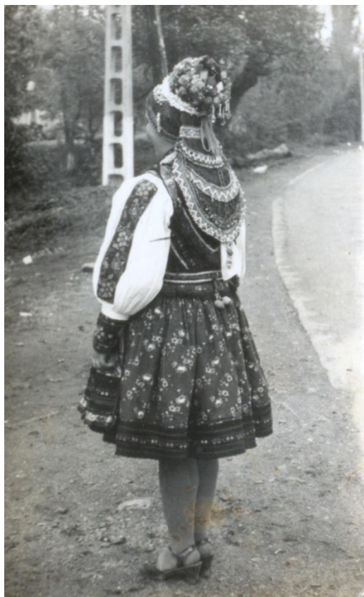
Mireasă cu cunună tradițională, cu coadă lată împletită, îmbrăcată cu sugmă cu foslan (1980)