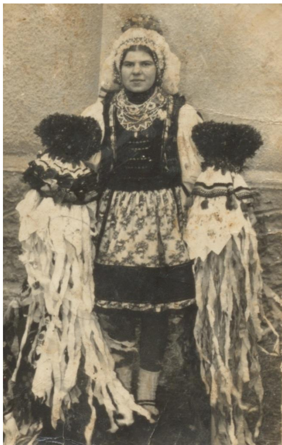
Mireasă în portul popular oșenesc cu cele două steaguri (1980)