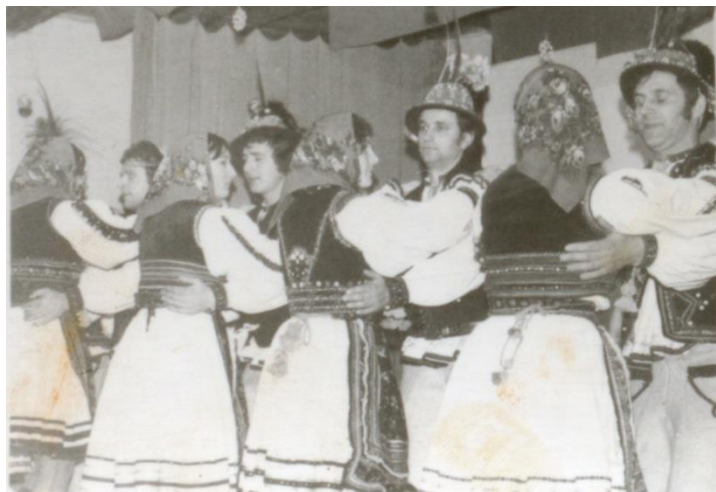
Dans oșenesc (1975)