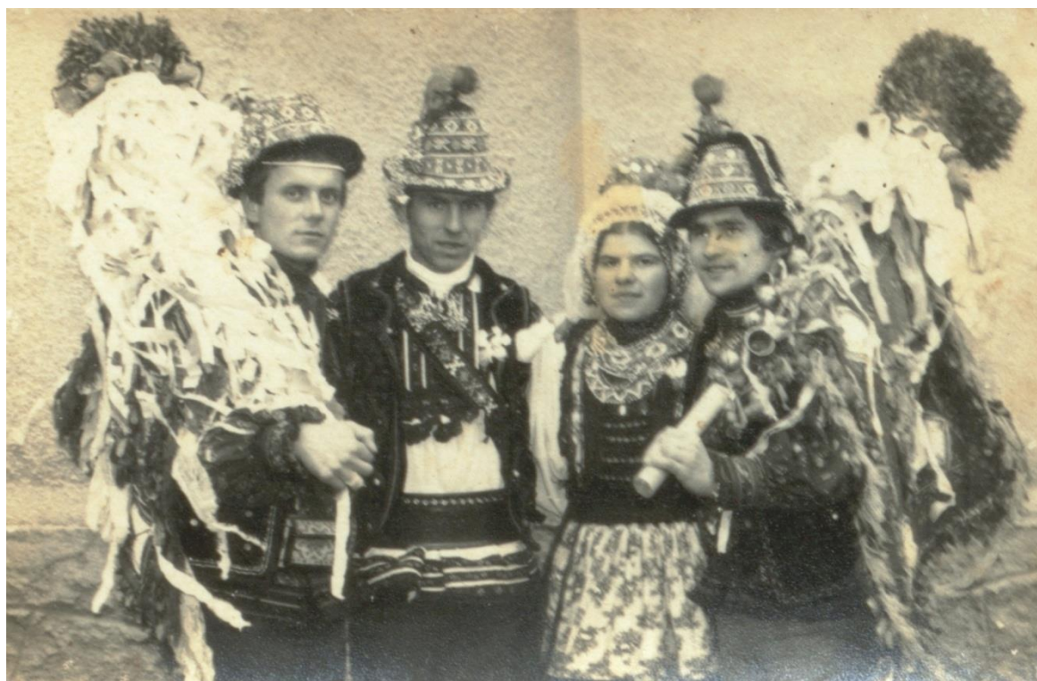
Miri în costume tradiționale oșenești, alături de cei doi ”stegași” (1980)