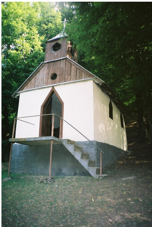
Capela romano-catolică de la Băile termale Tarna Mare