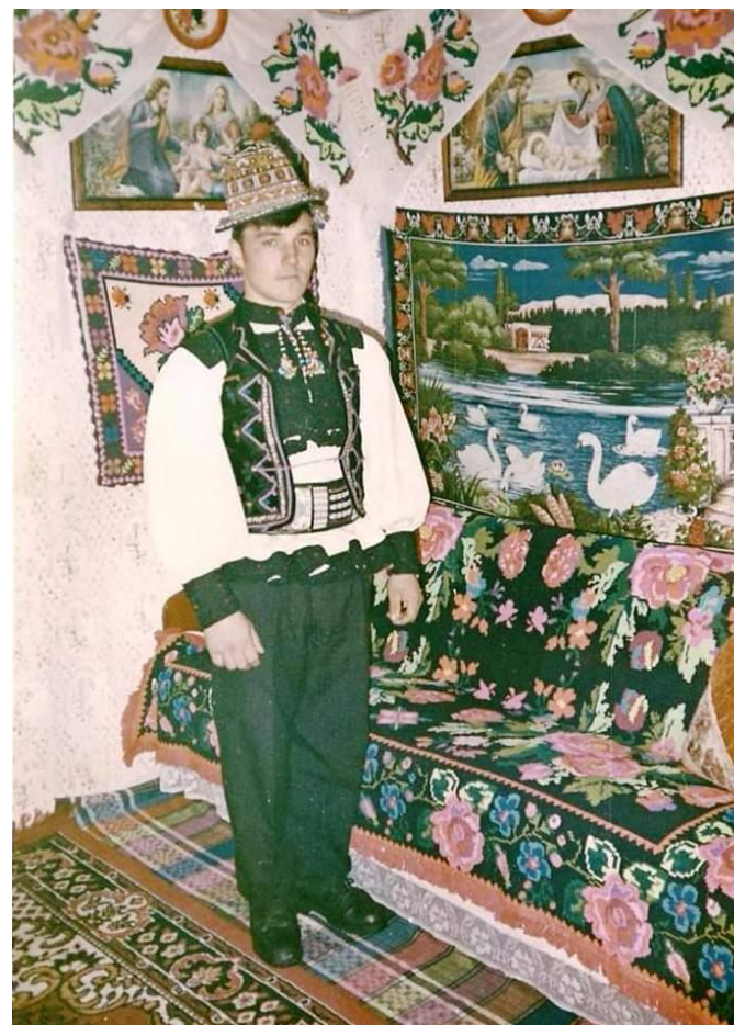
Port tradițional oșenesc din Tarna Mare

Proiect finanțat de Ministerul Culturii și Identității Naționale Beneficiarul proiectului: Județul Satu Mare, Consiliul Județean Implementat și coordonat de Biblioteca Județeană Satu Mare