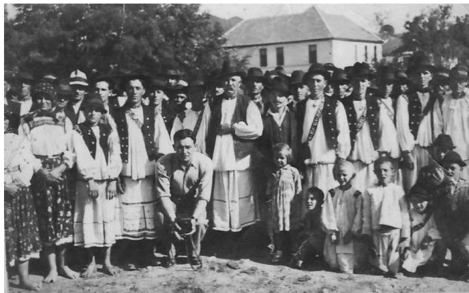
Oșeni în zi de sărbătoare (1958)

Proiect finanțat de Ministerul Culturii și Identității Naționale Beneficiarul proiectului: Județul Satu Mare, Consiliul Județean Implementat și coordonat de Biblioteca Județeană Satu Mare