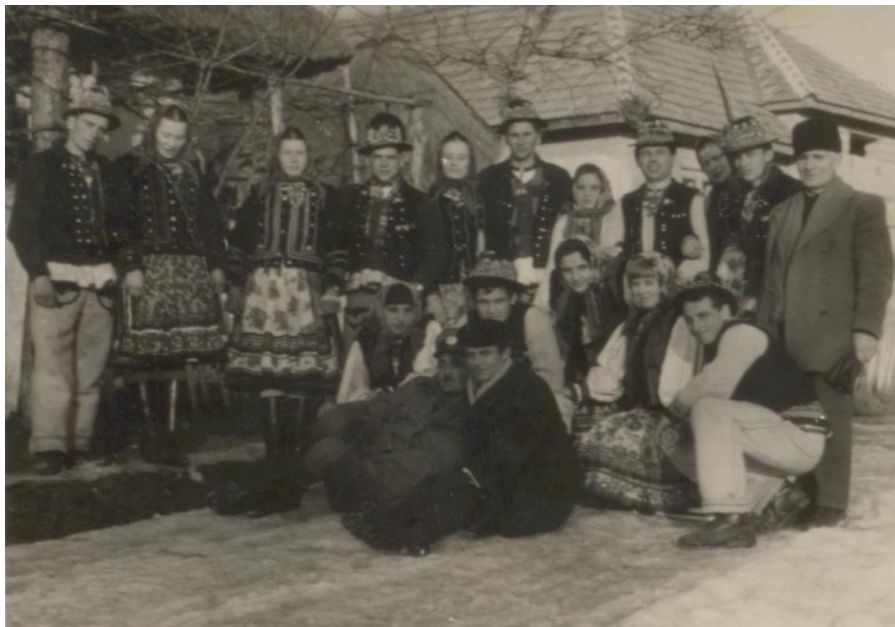
Formație de dansuri din Valea Seacă (1969)