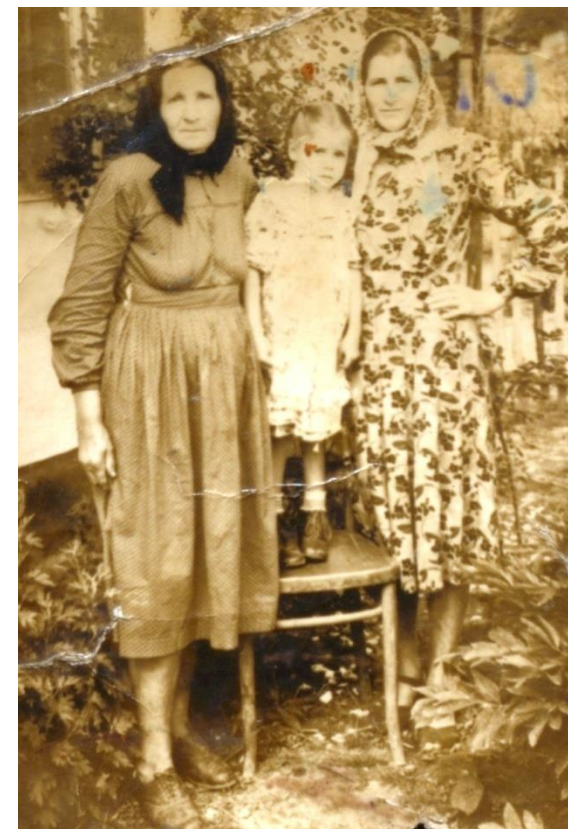
Două surori și o nepoată (1921)

Proiect finanțat de Ministerul Culturii și Identității Naționale Beneficiarul proiectului: Județul Satu Mare, Consiliul Județean Implementat și coordonat de Biblioteca Județeană Satu Mare