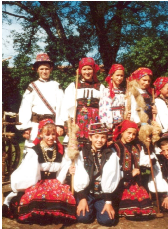
Șezătoarea „torsul fuiorului” (2010)