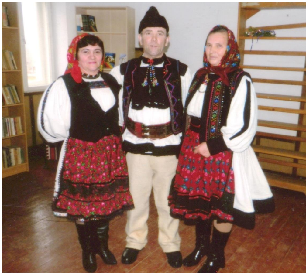
Port popular tradițional păstrat neschimbat din anii `60 (2015)

Proiect finanțat de Ministerul Culturii și Identității Naționale Beneficiarul proiectului: Județul Satu Mare, Consiliul Județean Implementat și coordonat de Biblioteca Județeană Satu Mare