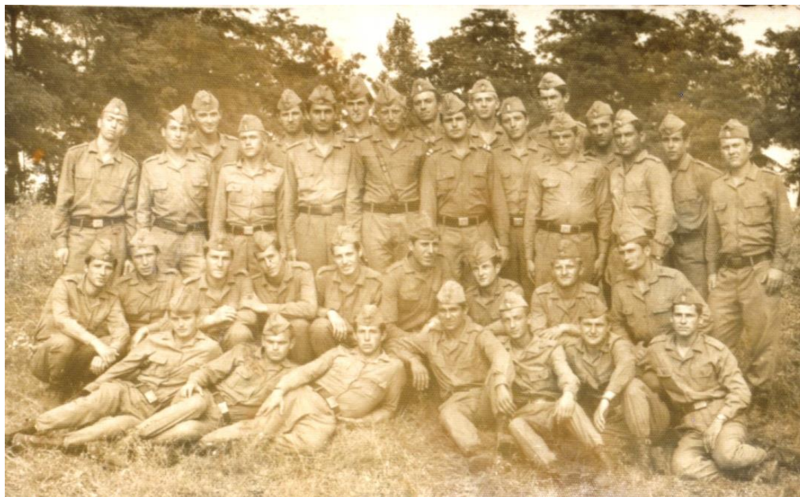
Grup de militari români (1980)

Proiect finanțat de Ministerul Culturii și Identității Naționale Beneficiarul proiectului: Județul Satu Mare, Consiliul Județean Implementat și coordonat de Biblioteca Județeană Satu Mare