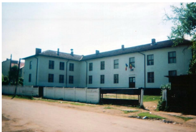
Clădirea școlii din Tarna Mare