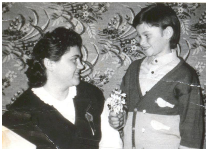
8 martie 1988, Ziua Mamei

Proiect finanțat de Ministerul Culturii și Identității Naționale Beneficiarul proiectului: Județul Satu Mare, Consiliul Județean Implementat și coordonat de Biblioteca Județeană Satu Mare