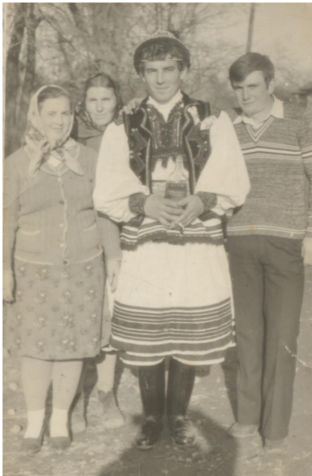
Bărbat în straie oșenești (1978)