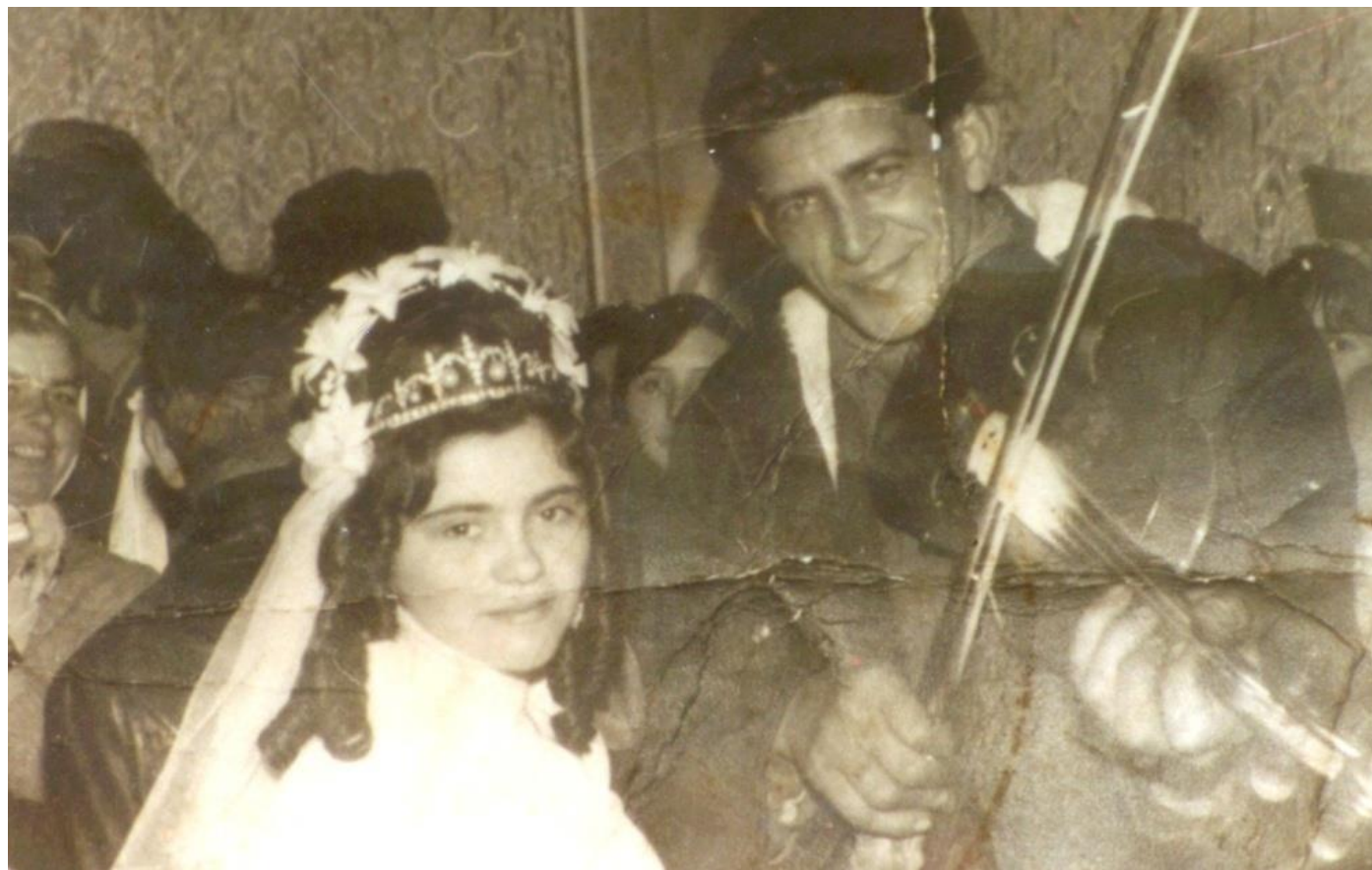
Ceterașul îi cântă miresei (1982)

Proiect finanțat de Ministerul Culturii și Identității Naționale Beneficiarul proiectului: Județul Satu Mare, Consiliul Județean Implementat și coordonat de Biblioteca Județeană Satu Mare