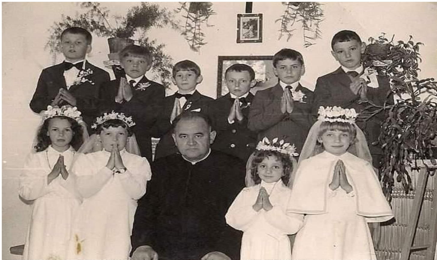
Tarna Mare, anii 70, prima împărtășanie la Biserica greco-catolică din localitate

Proiect finanțat de Ministerul Culturii și Identității Naționale Beneficiarul proiectului: Județul Satu Mare, Consiliul Județean Implementat și coordonat de Biblioteca Județeană Satu Mare