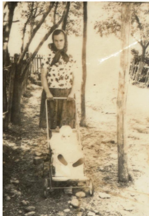
Mama și copilul, la plimbare pe ulițele satului (1972)