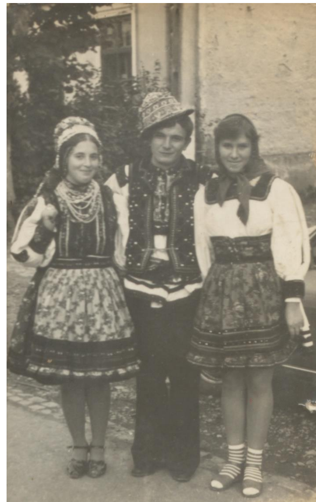
Miri și drujba (1983)