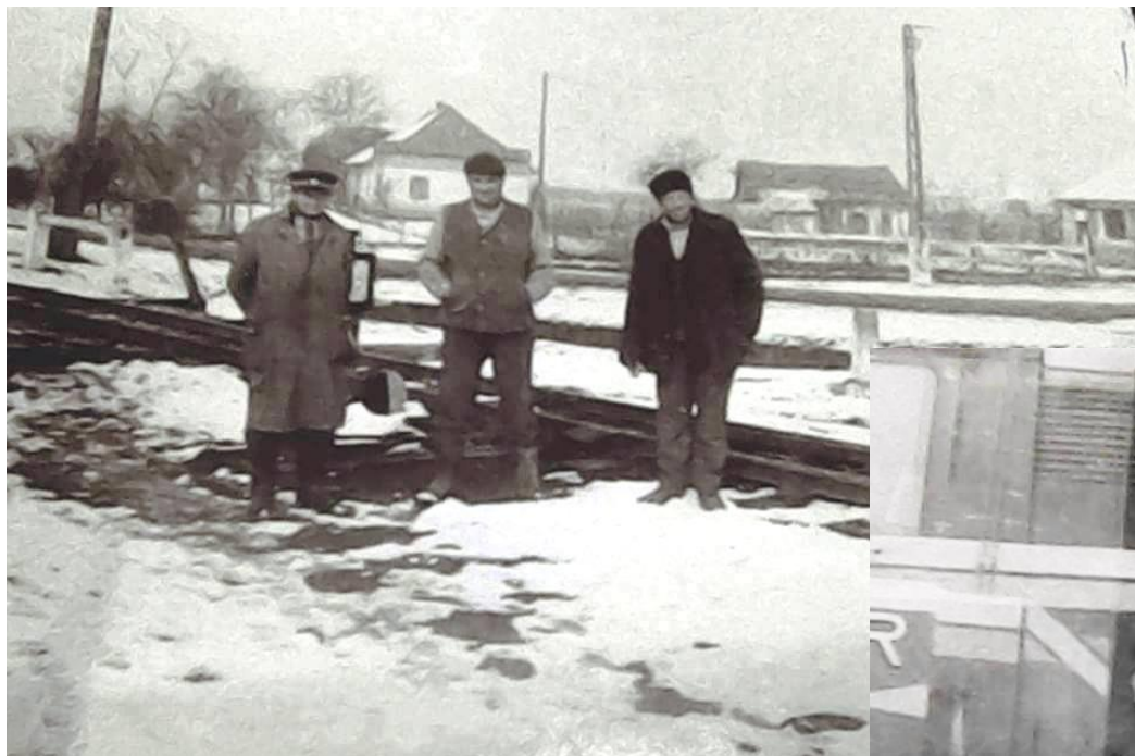
CFR-iști în 1986