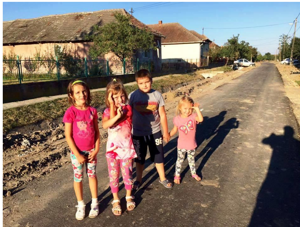
În vizită la bunici, pe strada mică

Proiect finanțat de Ministerul Culturii și Identității Naționale Beneficiarul proiectului: Județul Satu Mare, Consiliul Județean Implementat și coordonat de Biblioteca Județeană Satu Mare