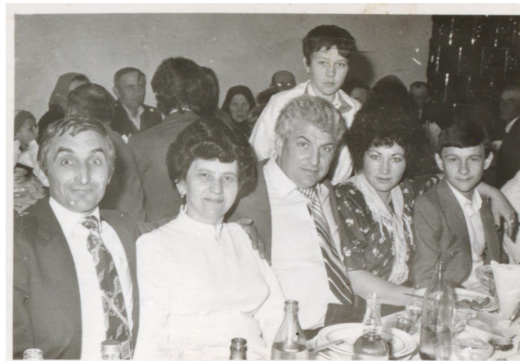
Masă festivă 1982

Proiect finanțat de Ministerul Culturii și Identității Naționale Beneficiarul proiectului: Județul Satu Mare, Consiliul Județean Implementat și coordonat de Biblioteca Județeană Satu Mare