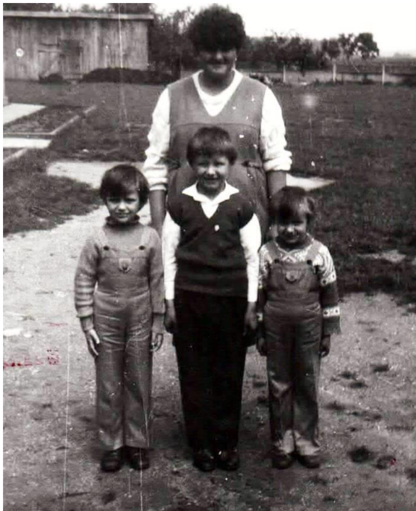
Sfârșit de an școlar 1980