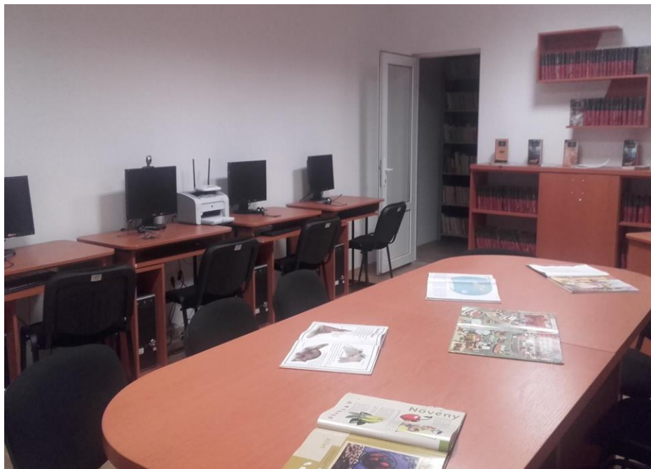
Biblioteca Comunală "Nae Antonescu" după reabilitare