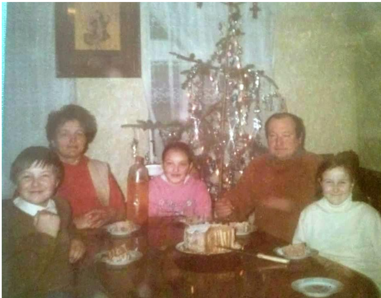
Crăciunul în familie 1980

Proiect finanțat de Ministerul Culturii și Identității Naționale Beneficiarul proiectului: Județul Satu Mare, Consiliul Județean Implementat și coordonat de Biblioteca Județeană Satu Mare